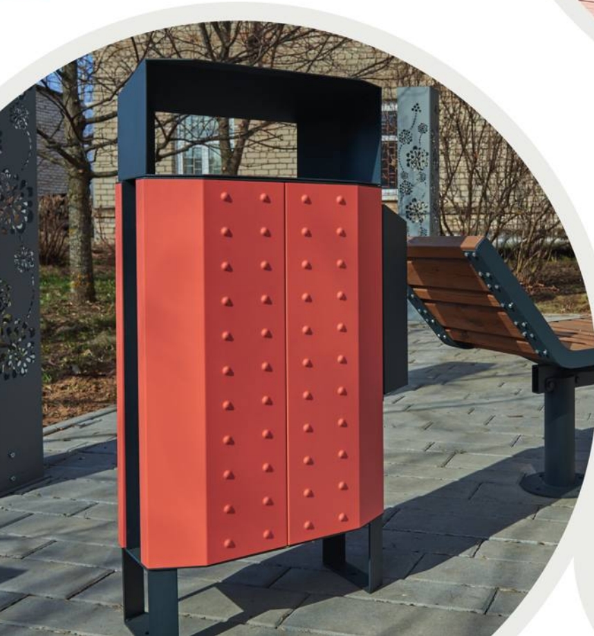
Litter bin / trash can