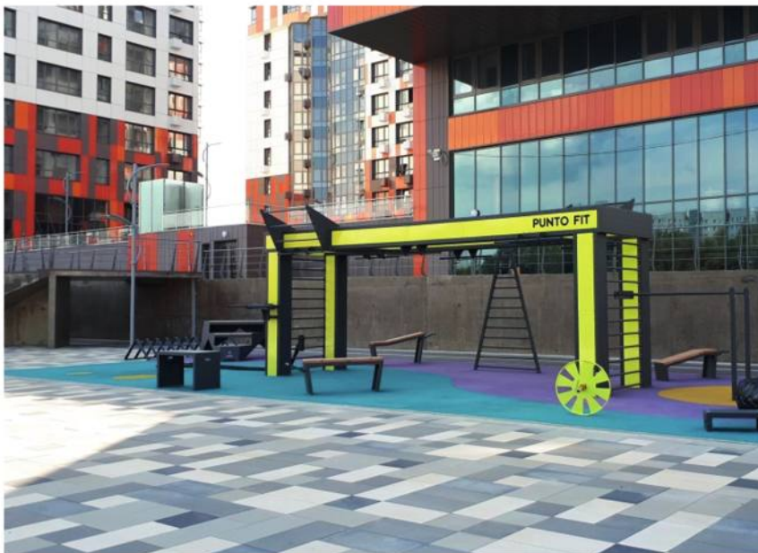
Frame 8,4 m