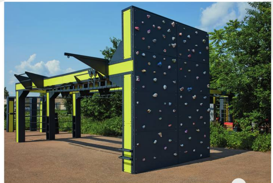
Frame 8.4 m with climbing wall