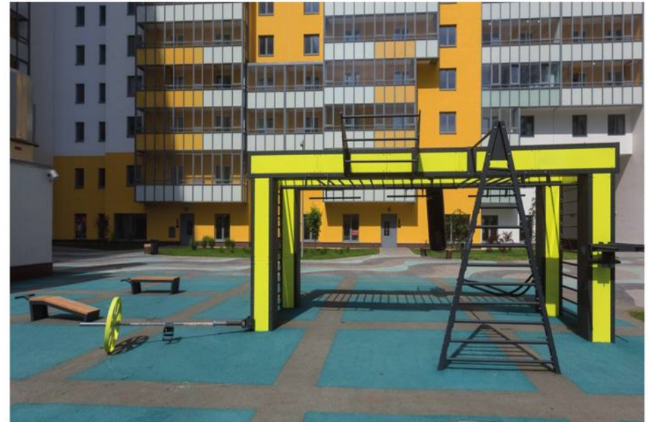
Frame 6 m