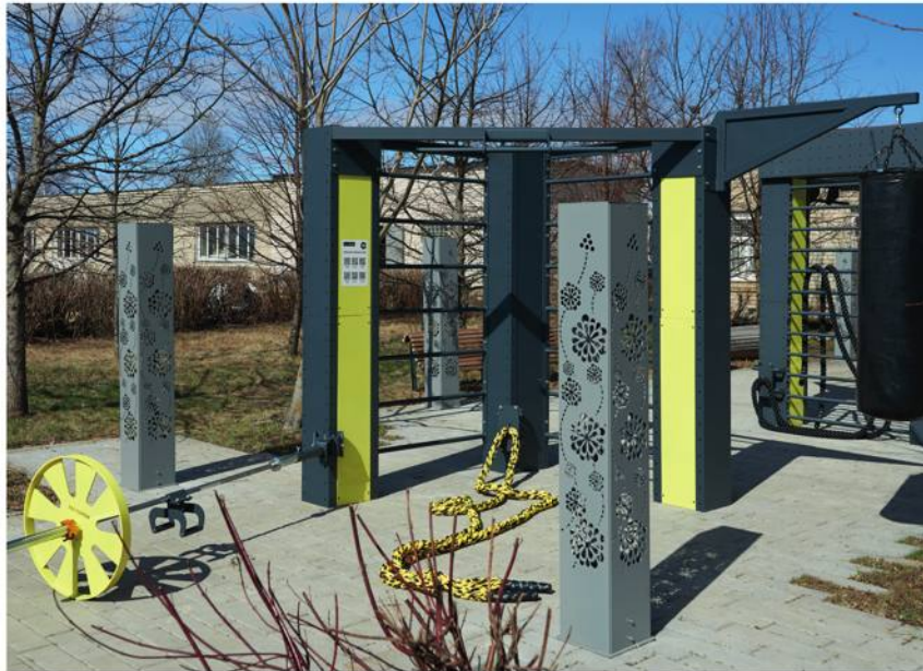
Frame 2 m